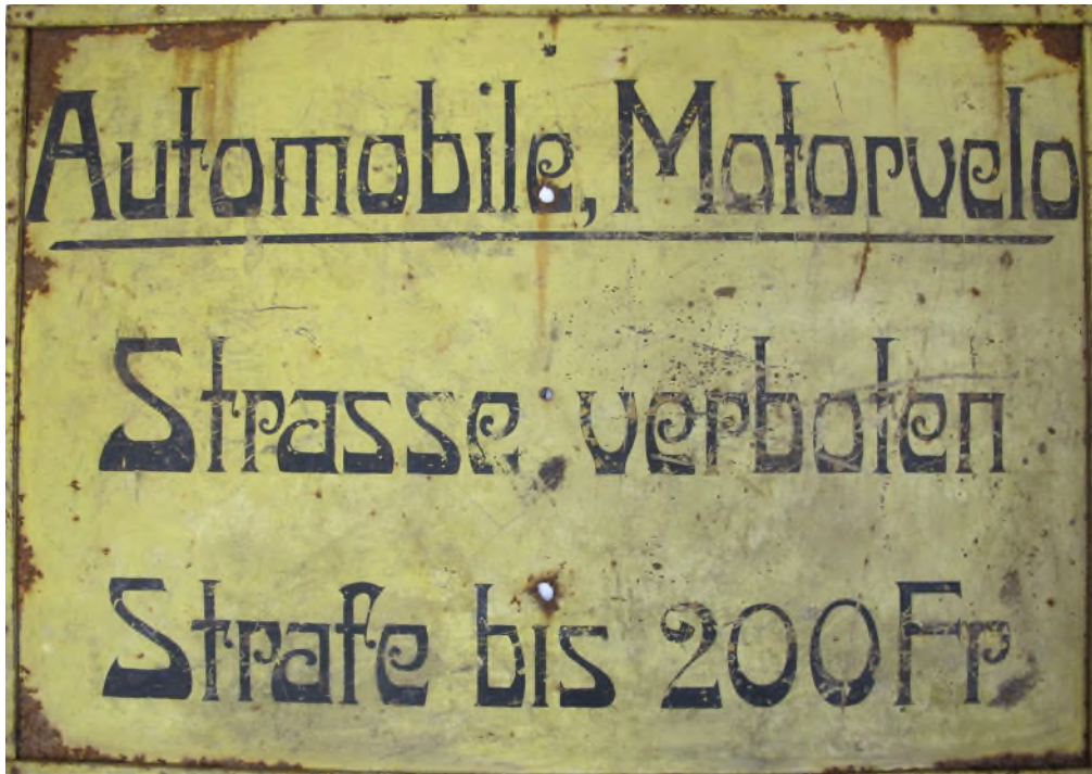
NM 14344, Strassenschild