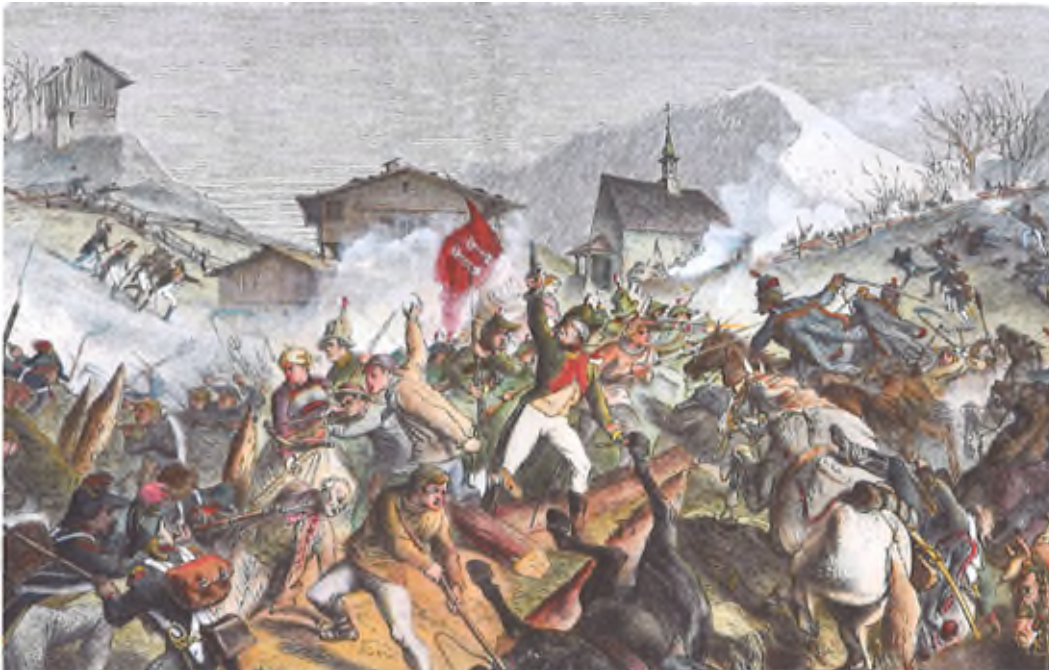
NM 6239, Franzosenüberfall