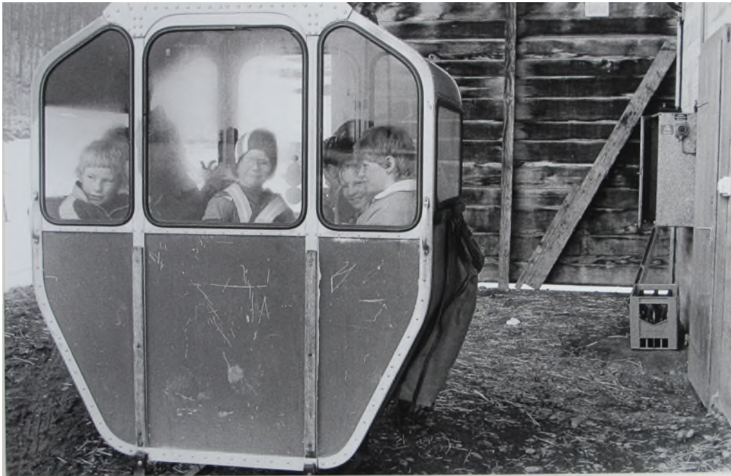
NM 10966, Schulweg mit der Seilbahn, Talstation Diegisbalm, Wolfenschiessen