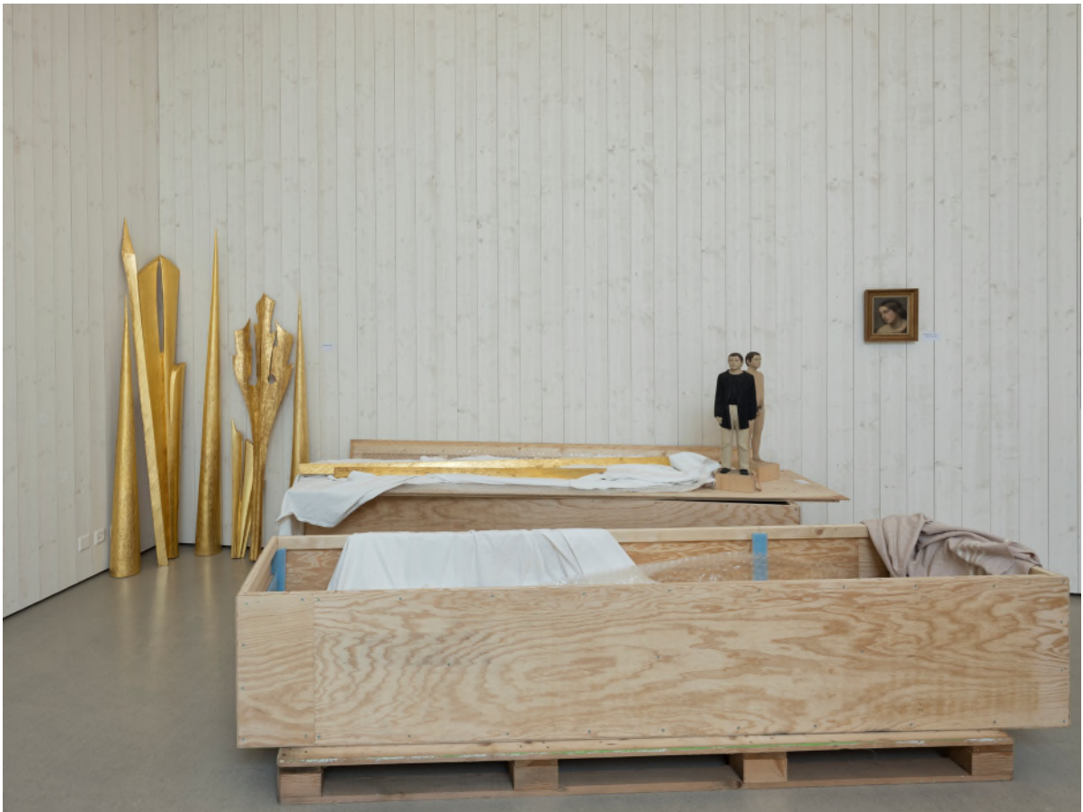
Samlungsausstellung, Sommer im Museum 2019

Praxisleitfaden für die Arbeit in der Sammlung des Nidwaldner Museums