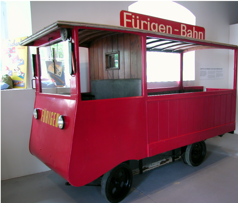
NM 12843, Elektromobil Hotel FÜRIGEN