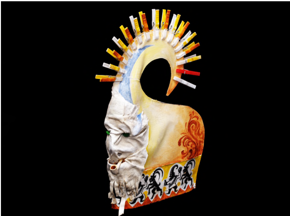
NM 11268, Geiggelschopf José de Nève