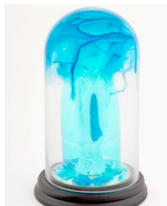
Esther Wicki-Schallberger: «Sancta Maria». Glasglocke.

auf Glas, die nach seinem Tod mit schwarzem Papier hinterlegt wurden und heute zur Hinterglasmalerei zählen. Aus dem Fundus des Nidwaldner Museums wird unter anderem die «Flucht nach Ägypten» gezeigt.