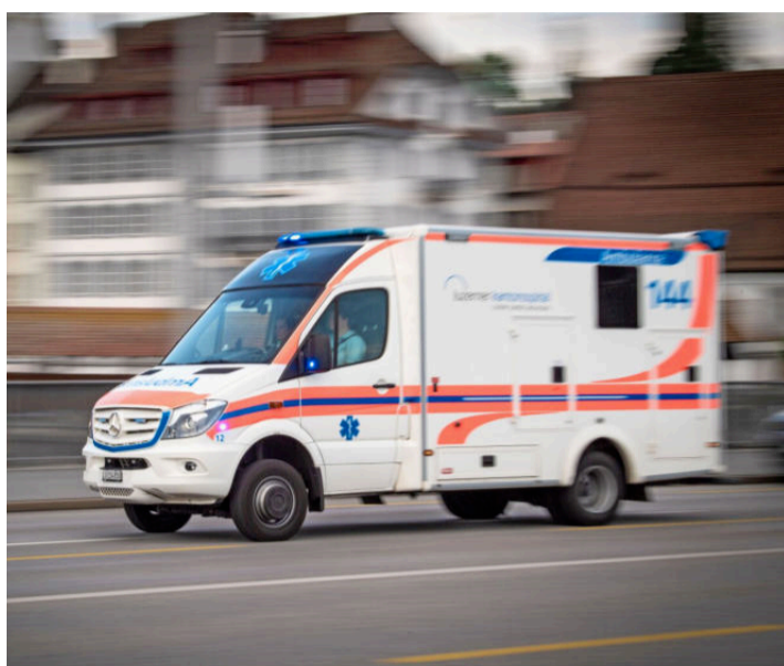
Bei Rettungseinsätzen dürfen Blaulichtorganisationen schneller fahren als erlaubt – geblitzt werden sie trotzdem.

In seinem Vorstoss stellt Schuler nun Fragen an den Regierungsrat. So will er etwa wissen, wie dieser die aktuelle Handhabung von Geschwindig-