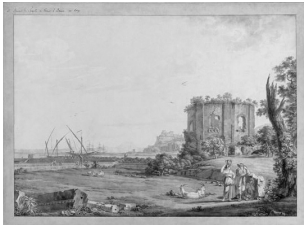
Abb. 1: Christoph Heinrich Kniep, Blick auf den Venus-Tempel in Baja , 1787, Feder und Pinsel in Braun über Bleistift, 60 × 81.5 cm, Kunsthandel Röbbing München

Im Jahr 1826 machte die Entdeckung der Blauen Grotte auch die Insel Capri zu einem beliebten Sehnsuchtsort. Leuw hielt sich oft dienstlich dort auf und reiste in den 1870er-Jahren wieder nach Capri, wo er unter anderem die Grotte Matromania besuchte.