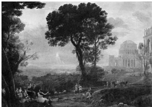
Abb. 2: Claude Lorrain, Ansicht von Delphi mit einer Prozession , 1650, Öl auf Leinwand, 150 × 200 cm, Rom, Galleria Doria Pamphilj