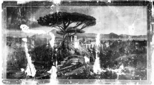
Abb. 3: Posthornsaal, italienische Landschaft, fotografiert 1959, Kantonsbibliothek Nidwalden, Nachlass von Matt

Louis Leuw brachte diese Motive zurück in die Heimat und dekorierte 1874 zum 50-Jahr-Jubiläum der Theatergesellschaft den Posthorn-Saal in Stans mit italienischen Landschaften (Abb.3). Der Saal gehörte zum Gasthof Posthorn, nach welchem sich die Theatergesellschaft damals Posthorn-Gesellschaft nannte. Im Jahr 1876 wurde eine grössere Bühne eingebaut, die den Posthornsaal Teil des neuen Theatersaals werden liess. Dort spielte sich von nun an das gesellschaftliche und kulturelle Leben von Stans ab. Die Wandmalereien von Leuw wurden später im Rahmen von baulichen Erweiterungen zugedeckt, 1959 wiederentdeckt, beim grossen Theaterumbau in jenen Jahren aber zerstört.