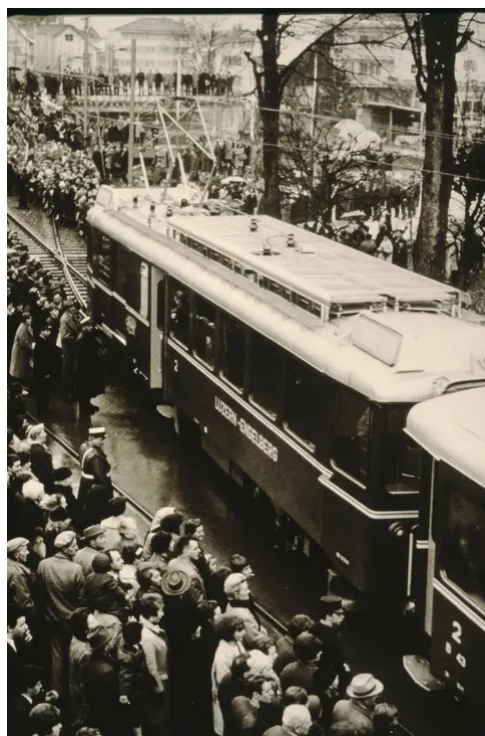
Ankunft der Jungfernfahrt der LSE am 19. Dezember 1964 in Engelberg. Das Rollmaterial war nur mit „Luzern-Engelberg“ beschriftet.

Das Thema der Ausstellung ist nicht nur hochaktuell, sondern auch brisant, und speziell Nidwalden weist eine einzigartige Verkehrsgeschichte auf, heisst es.