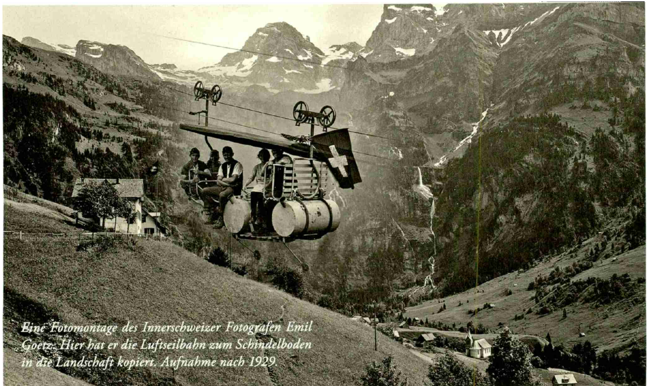
Eine Fotomontage des Innerschweizer Fotografen Emil Goetz. Hier hat er die Luftseilbahn zum Schindelboden in die Landschaft kopiert. Aufnahme nach 1929

Luftseilbahnen verbinden Menschen, Orte und ab Herbst auch drei Ausstellungshäuser in Flims, Stans und Zürich. Das Gelbe Haus Flims, das Nidwaldner Museum in Stans und das Heimatschutzzentrum in Zürich planen gemeinsam eine lustvolle, interaktive und wissensreiche Ausstellung zur Luftseilbahn.