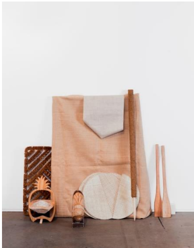
Sophie Nys, „Keiner soll hungern! Keiner soll frieren!“, 2013, Coco, jute, wood, hygienic sand, coconut soap. 110 x 140 x 40 cm, Ausstellungsansicht Art Rotterdam 2013. Bildlink