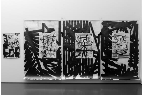
Samuli Blatter, „Glyph“, 2016, Ausstellungsansicht Caravan 3/2016, Aargauer Kunsthaus, Aarau, Foto: Timo Ullmann, Aarau. Bildlink