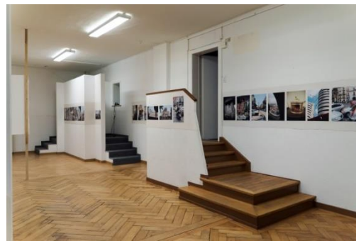
Katalin Deér, „adesso, now, You, salve“, Ausstellungsansicht Nextex St. Gallen 2017. Bildlink